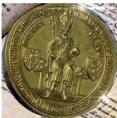
Zlatá bula sicilská (1212)

Výraz se používal už v antice, kde znamenal nejprve pouzdro, které svobodní muži nosili na krku jako amulet. Vedle toho se užíval i pro pečetí, byly to tehdy kousky hlíny na koncích provázku, jímž byl ovázán svitek, svinutá listina. Do hlíny se někdy otiskovalo pečetidlo. Hlína pak byla v raném středověku nahrazena voskem, chráněného pouzdrům. Papežské slavnostní listiny se pečetily olovem, což je doloženo od 6. st. Byzantští a pak i římské císařové užívali i zlatou pečeť – odtud Zlatá bula.